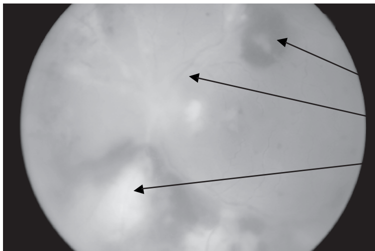
1 pav. Dešinės akies dugnas trečiąją ligos savaitę (nuotr. doc. V. Barzdžiuko, atlikta fundus kamera).

Chorioretinaliniai židiniai su hemoragijomis, stiklakūnio ofuskacija