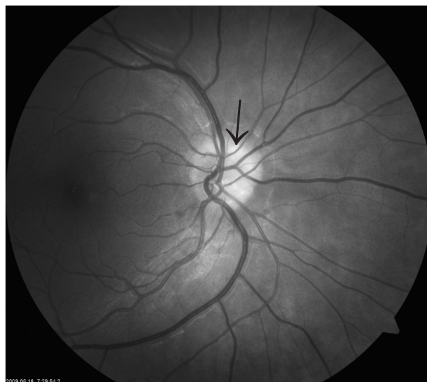
1 pav. Dešinės akies regos nervo disko viršutiniame nazaliniame kvadrante matoma didelė regos nervo disko drūza

Siekiant nuodugniai įvertinti regą, tiriamos įvairios jos funkcijos: kognityvus suvokimas, regos sistemos sveikata, centrinių sistemų apdorojimo funkcija. Tyrimai parodė, kad regos funkcijos tyrimui